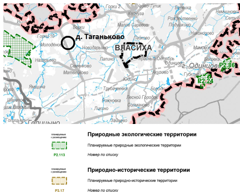
Рисунок 2.8.3. Фрагмент Карты планируемого размещения объектов регионального значения в иных областях в соответствии с полномочиями Московской области. Планируемые природные экологические и природно-исторические территории регионального значения

В соответствии со Схемой территориального планирования Московской области – основными положениями градостроительного развития, утвержденной постановлением Правительства Московской области от 11.07.2007 № 517/23 (в редакции постановления Правительства Московской области от 11.10.2021 № 992/33), в границах земельного участка с кадастровым номером и на смежных с ним территориях Одинцовского городского округа не предусматривается организация природных экологических и природно-исторических территорий (рисунок 2.8.3).